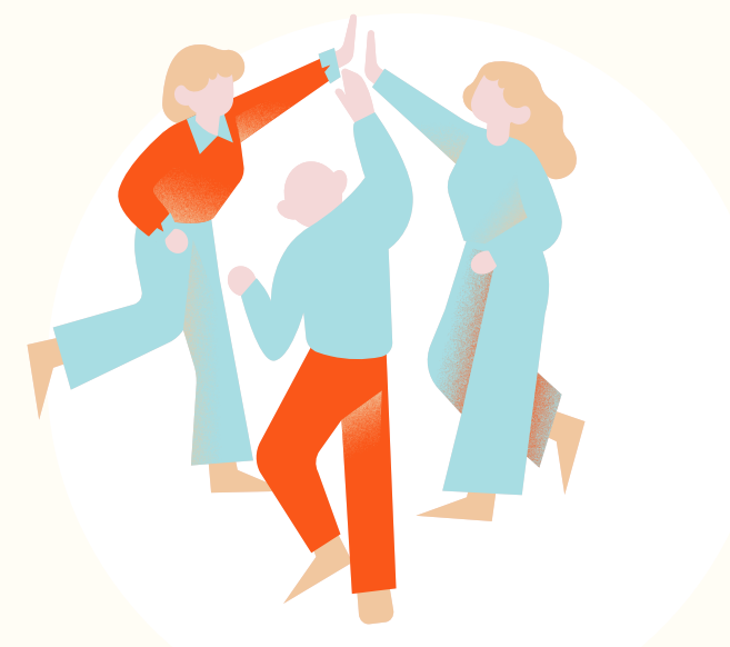
サービス導入開始